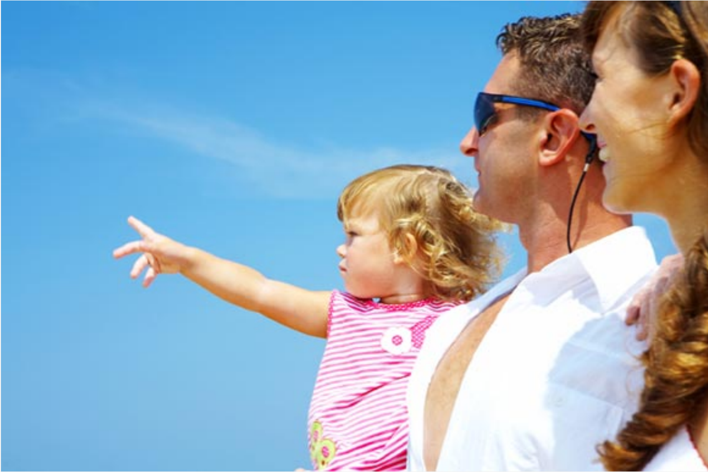
in raw

Das Eltern-Kind-Verhältnis wird hauptsächlich geprägt durch den Bewusstseinsgrad der Eltern. Je bewusster die Eltern ihr Kind wahrnehmen und mit ihm umgehen, desto besser und intensiver wird sich auch das Verhältnis gestalten.